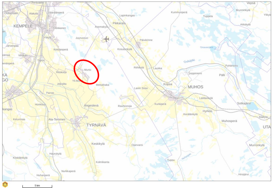
Kuva 1. Kaava-alueen seudullinen sijainti (Paikkatietokkuna/MML. Haettu 5.4.2019.)

144-160, 859-402-35-46, 859-402-21-11, 859-402-21-47 ja yksityisen omistamasta tai vuokraamista tonteista.