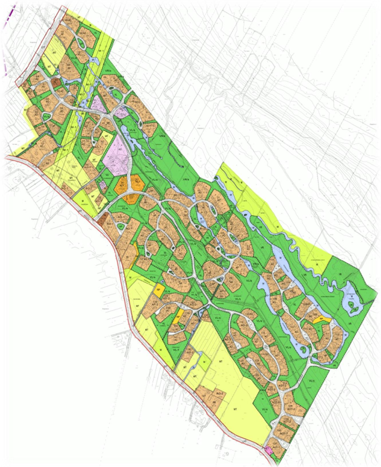
Kuva 2. Ote Murren asemakaavayhdistelmästä 5.4.2019.