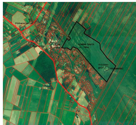
Kunnan omistama maa-alue ja mahdollinen kaavan laajenemissuunta.

Murron asuinalueelta ja koululta on kantautunut huoli Murron koulun vähenevästä oppilasmäärästä. Alueelle toivotaan lisää asutusta, jotta kylän palvelut ja elinvoimaisuus säilyisivät. Kunta omistaa kaavoitusta varten ostamaansa maata olevan asemakaava-alueen pohjois-koillisreunalta.