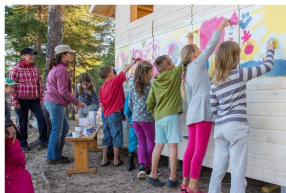
Kaavoituksen ja suunnitteluun voi osallistua monella eri tavalla.

Kaavaehdotuksen nähtävillä olon jälkeen kaava etenee hyväksymiskäsittelyyn. Kunnanhallitus hyväksyy vaikutuksiltaan vähäiset asemakaavamuutokset, muutoin kaavat hyväksyy kunnanvaltuusto. Mahdolliset muistutukset käsitellään ennen kaavan hyväksymistä. Kaavan hyväksymisestä ilmoitetaan kuulutuksella paikallislehdessä ja kunnan internet-sivuilla.