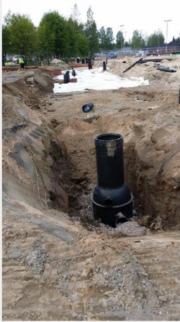
Sadevesikaivojen ja – linjojen asennus käynnissä

Salaojaviemäreiden, sadevesikaivojen ja – putkilinjojen asennus jatkuu ensi viikolla. Maalämpökaivojen poraukset jatkuvat ensi viikolla. Routaeristeiden asennus sekä VSS seinäraudoituksien teko jatkuvat ensi viikolla. Tällä viikolla saimme valettua valmiiksi VSS: n ja keittiön välisen paalulaatan sekä keittiön ontelolaattojen välit.