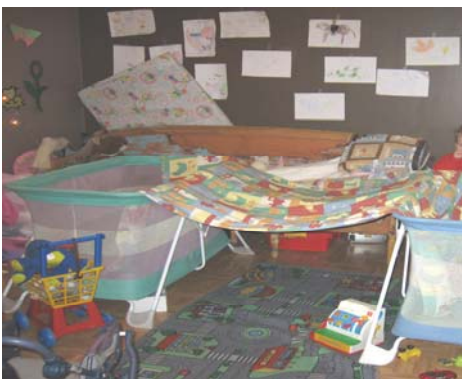
Lasten majaleikki nukkumahuoneessa.

Perhepäivähoitajan tehtävä on antaa mahdollisuus omaehtoiseen, mielikuvi- tus/roolileikkiin (poliisi/rosvo, eläintenhoitaja, kotileikki, lääkäri, kauppa), sääntöleikkiin (pelit, laulu- ja liikuntaleikit) ja esineleikkiin (legot, rakennuspalikat, autot). Hoitajalla on suosituslista leikkivälineistä, mitä hänen kodissaan tulisi olla.